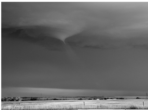
Fig. 1. Tornado [5]

El departamento del Atlántico se ha visto afectado en los últimos años por la presencia de tornados y microtornados que se han generado causando grandes daños y temor en la población. La presencia de este fenómeno meteorológico ha sido tal que organismos como el CAF (Corporación Andina de Fomento) y el Departamento de Atención de desastres del departamento han tomado acciones para tratar de educar a la población en este aspecto. Algunos sólo terminan en amenazas, pero son índices de que la población del departamento es vulnerable a la presencia de tornados, lo que indica a que se tenga un especial cuidado en cuanto a las medidas de alertas y formas de educar y mitigar su efecto en la población que puede ser afectada ante este fenómeno meteorológico.