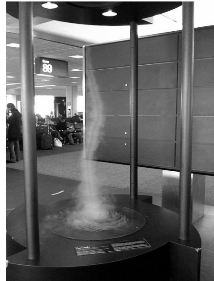
Fig. 9. Simulador de tornado ubicado en el aeropuerto de san Francisco – Estados Unidos. [22]

Otros simuladores utilizan en su diseño un humidificador con el fin de que se pueda observar este fenómeno con mayor claridad y el ventilador lo ubican en la parte superior.