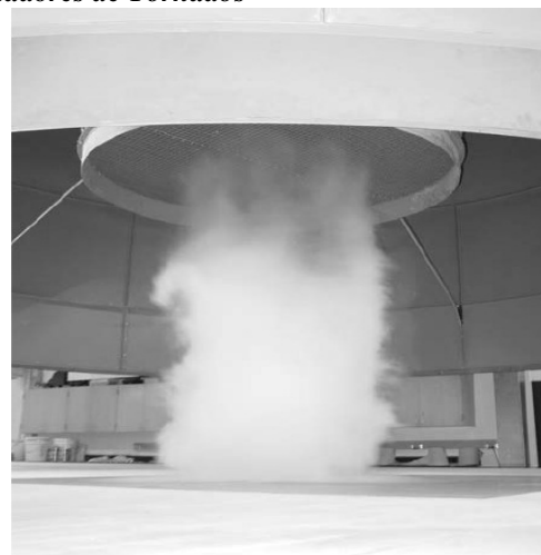
Fig. 7. Simulador de tornado Universidad de Iowa. [24]

Existen otros tipos de avances pero enfocados para el estudio de los tornados, y son los denominados simuladores de tornados.