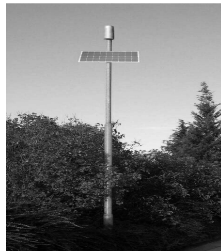
Fig. 4. Detector de Tornado O’Conner. [19]

En el año 2010 desde el 1° de Mayo al 15 de Junio se realizó una misión denominada VORTEX 2, (siglas en inglés de Experimento de Verificación del Origen de la Rotación en Tornados) en donde científicos e investigadores de Norteamérica y Europa realizaron en Estados Unidos la caza de tornados con el fin de generar nueva información con relación a este fenómeno para estudiar más a fondo las causas exactas de formación de tornados ya que aún se desconocen del todo. Vortex 2 posee una flotilla de vehículos equipados con una variedad de sensores para medir parámetros de los tornados. La mayoría de estos sensores son de efecto Doppler y generan diversas frecuencias.