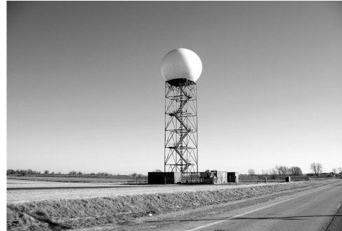
Fig. 2. Radar Doppler Illinois – Usa, similar al que se planea instalar en Medellín. [17]

Debido a la ya mencionada problemática de los tornados en el departamento del Atlántico, se considera prudente realizar una revisión de los principales avances tecnológicos en el estudio de este fenómeno, el cual pueda ayudar a encausar y concientizar algunas necesidades que son requeridas para mitigar los daños que puede causar la presencia de un tornado.