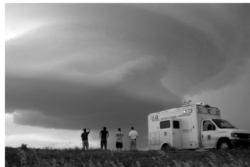
Fig. 3. Misión Vortex 2. [18]

Existen también otros tipos de avances tecnológicos para el estudio de los tornados, algunos usados para la detección y generar alertas tempranas, como los mismos radares Doppler pero menos complejos, ubicados en la superficie terrestre. Para tomar datos para el estudio de los tornados existen grupos de investigadores y científicos que son llamados “cazatornados” y que con ayuda de las entidades meteorológicas se encargan de “cazar” los tornados y tomar mediciones cercanas.